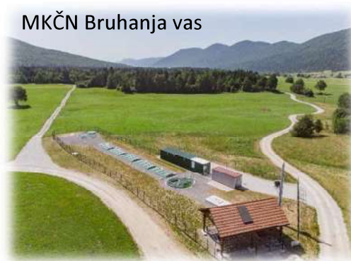
MKČN Bruhanja vas