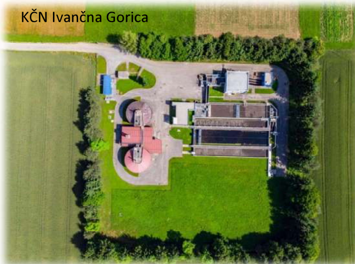
KČN Ivančna Gorica